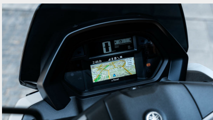
Tableau de bord TFT connecté de 4,2 pouces

Le NMAX 125 Tech MAX est équipé d'élégants feux arrière à LED, ainsi que de clignotants à LED intégrés qui confèrent à ce scooter urbain sportif une allure dynamique et contemporaine.