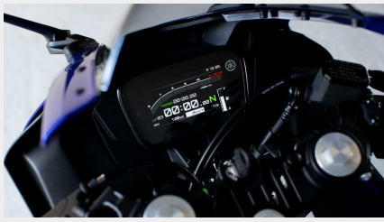
Tableau de bord TFT 5 pouces inspiré de la R1

Le tableau de bord TFT couleur de 5 pouces inspiré de la R1 vous fournit des informations claires et renforce le caractère haut de gamme et le niveau d'équipement exceptionnel de la R125. Sélectionnez l'un des thème « Street » ou « Track » selon la situation de pilotage et ajustez facilement le témoin de changement de vitesse programmable et la plage du compte-tours par incréments de 200 tr/min en fonction de votre style de pilotage et de vos préférences personnelles.