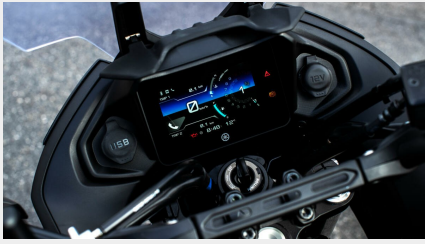
Tableau de bord TFT connecté

La TRACER 7 est équipée d'un tableau de bord TFT couleur de 5 pouces de qualité supérieure avec deux thèmes d'affichage sélectionnables : Touring ou Sport. Grâce à la connectivité pour smartphone offerte via l'application MyRide, vous recevez des notifications en cas d'appels, d'e-mails et de messages entrants. Vous pouvez également consulter des données de fonctionnement détaillées liées à votre Yamaha.