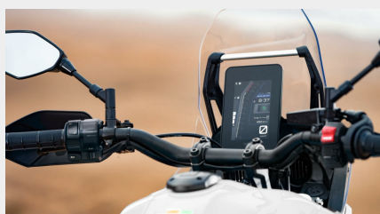
Tableau de bord avec écran TFT 5 pouces couleur connecté à votre smartphone

Le silencieux slip-on Akrapovič léger allie les performances, un look rallye et une sonorité grave, sans être pour autant bruyant. Il est homologué et intègre une protection thermique, un collier de fixation en carbone, ainsi qu'un embout « DB Killer » non amovible.